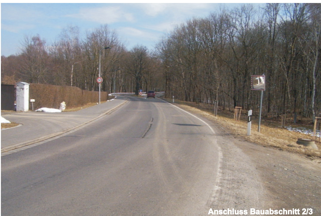
Anschluss Bauabschnitt 2/3

Auftraggeber Landratsamt Muldentalkreis Gemeinde Bennewitz